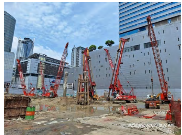
รูปที่ 1.5-1 สถานะของโครงการเดือนมีนาคม – มิถุนายน 2568